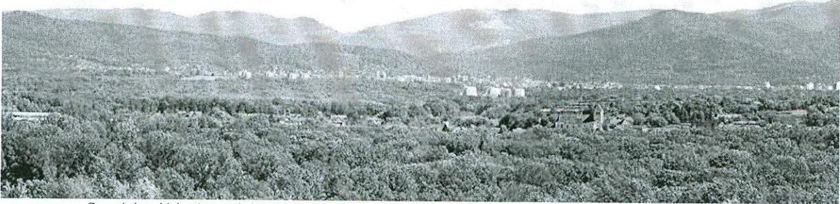
Gottenheim with its characteristic church spire rises out of the trees under Freiburg's and the Black Forest's gaze in the background.

The third aim of the Conference Series is to introduce academics to educational premises in locations that are suitable for study abroad programs and which may meet their students' educational needs. IJAS draws its inspiration from the Fulbright Program, an integral part of the United States' foreign educational relations, where face-to-face exchanges have proven to be the single most effective means of engaging international publics while broadening dialogue between academics and institutions.